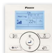
En option (BRC073)