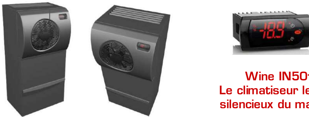
Wine IN50+ Le climatiseur le plus silencieux du marché